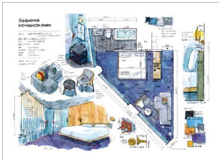
左：《PATISSERIE ASAKO IWAYANAGI Parfait Bijou de Noel》2025、 水彩、右：《東京ホテル図鑑 sequence MIYASHITA PARK》2023、水彩

この度、JR 上野駅構内のギャラリー「CREATIVE HUB UENO "es"」では、建築物のみならず、室内の家具や花瓶などの小物、さらには食べ物に至るまで、空間のリサーチとしてさまざまなものを測量し、「実測」の概念を超えた美しいスケッチを発表する、遠藤慧の初の個展「MEASURE: 空間を解剖する—実測スケッチの世界」を、2025年2月25日（火）から2025年3月23日（日）まで開催します。